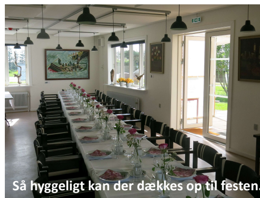
Så hyggeligt kan der dækkes op til festen.

Stue og udestue er gode rammer for forskellige arrangementer. Tænk på det når du skal afholde et arrangement. Solhjem skal ikke konkurrere med de arrangementer og aktiviteter der allerede foregår i området, men gerne tilføje noget nyt. Vores meget hyggelige stue med tilstødende udestue med Vendsyssels flotteste udsigt vil måske være noget du kan bruge.